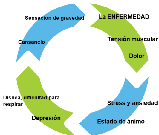
Fig 1 Pensamiento Negativo